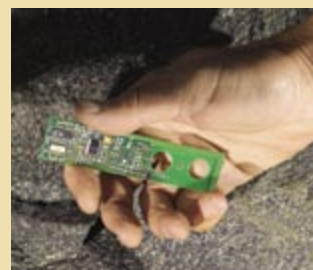
La etiqueta se instala en la caja de pilas del casco del personal y se monta en una caja rugosa en los vehículos.