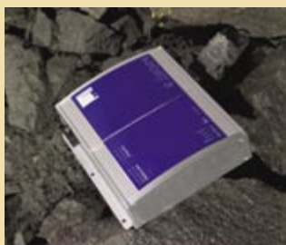
El lector tiene cuatro puertos de antenas para reducir el número de lectores y proporcionar direccionalidad.

Smart Tag será personalizado para responder a los requisitos específicos de su compañía. Nuestro equipo de expertos en software y hardware le apoyará en la implementación y el mantenimiento del sistema Smart Tag. Pueden comprarse licencias de software de hasta tres años para mantener sus instalaciones actualizadas con las nuevas versiones del producto.